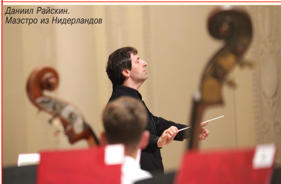
Даниил Райскин. Маэстро из Нидерландов