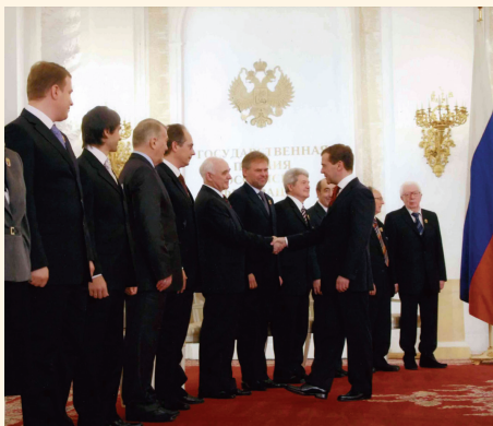
На церемонии вручения Государственной премии России

Начальник отдела финансирования образования и культуры Министерства финансов Свердловской области