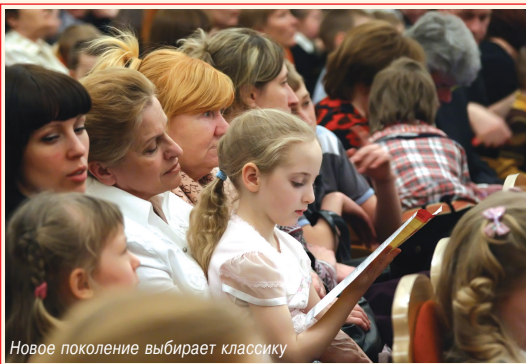
Новое поколение выбирает классику