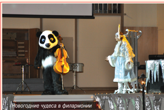
Новогодние чудеса в филармонии