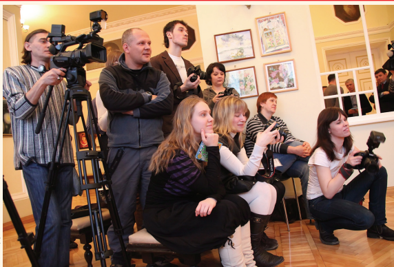
Всегда свежие новости