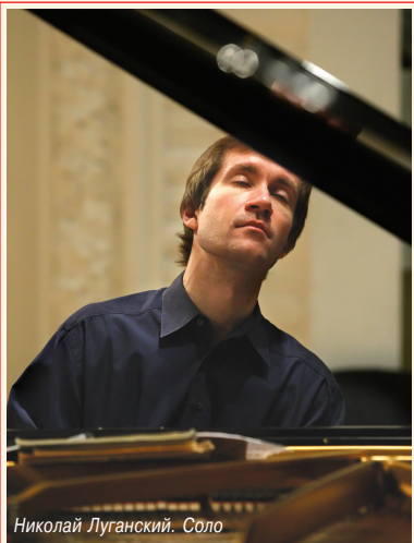
Николай Луганский. Соло