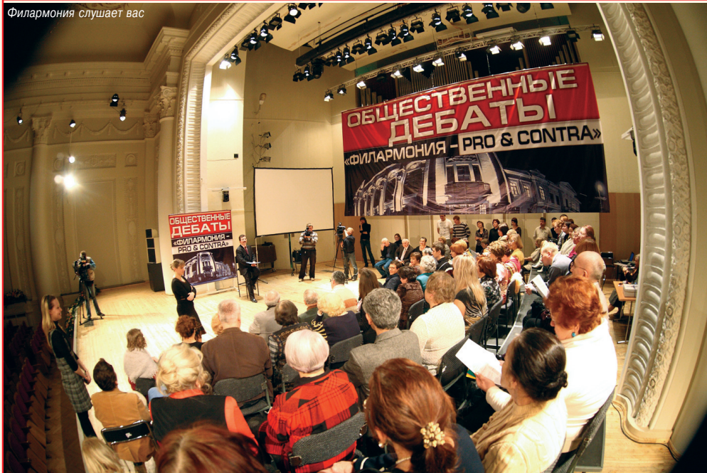
Филармония слушает вас