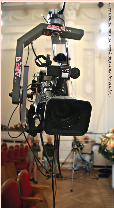
«Первая скрипка» Виртуального концертного зала