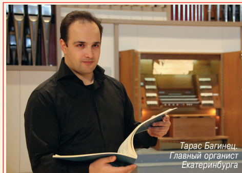
Тарас Багинец, Главный органист Екатеринбурга