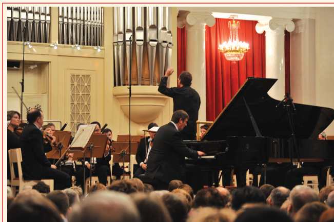
УАФО и Борис Березовский на «Площади искусств» в Санкт-Петербурге