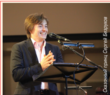
Сказочный принц Сергей Безруков