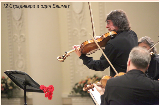
12 Страдивари и один Башмет