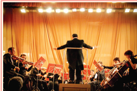
Два оркестра. Лучшее – филиалам!