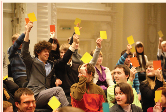
Молодым звездам у нас дорога: студенты дебатуют на сцене Большого зала