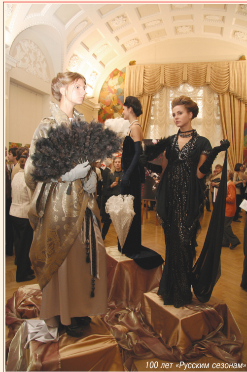
100 лет «Русским сезонам»