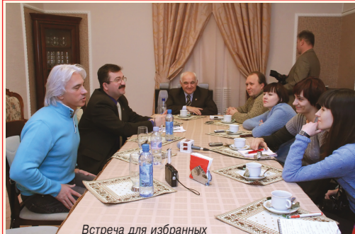
Встреча для избранных