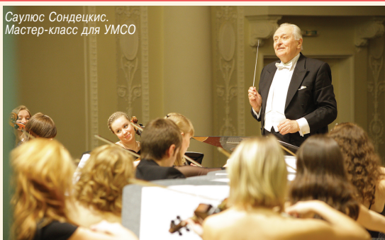
Саулюс Сондецкис. Мастер-класс для УМСО