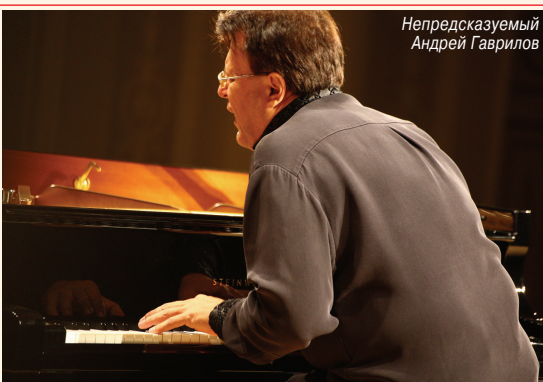
Непредсказуемый Андрей Гаврилов