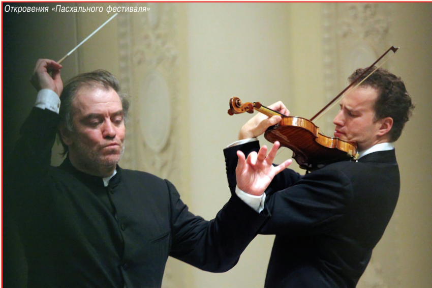
Откровения «Пасхального фестиваля»