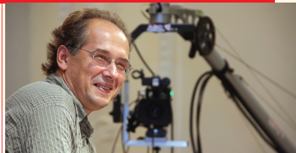
Реальная и виртуальная филармония