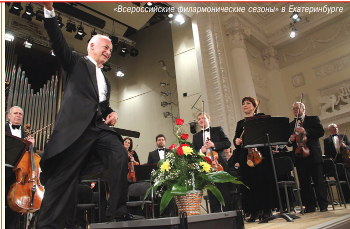
«Всероссийские филармонические сезоны» в Екатеринбурге