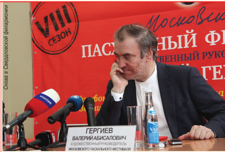
Снова в Свердловской филармонии