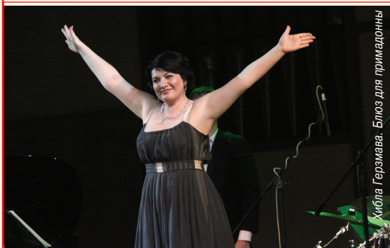
Хибла Герзмава. Блюз для примадонны