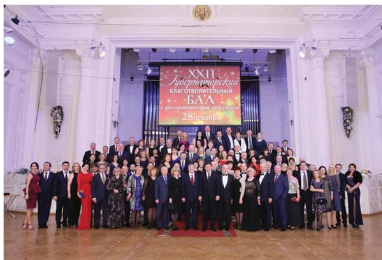
Губернаторский бал – 2015