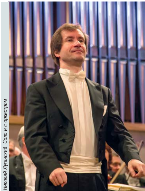
Николай Луганский. Соло и с оркестром