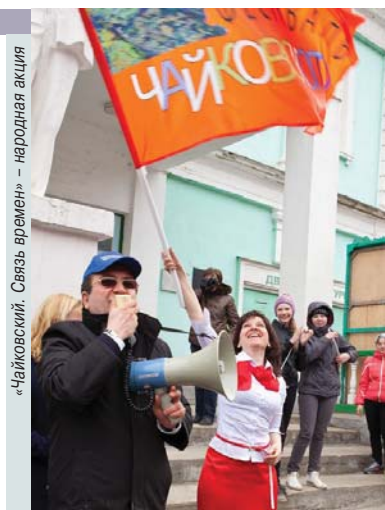
«Чайковский. Связь времен» – народная акция

On November 6, for the second time, the Sverdlovsk Philharmony took the lead in promoting a cultural and educational event. On that day, the entire Ural Region was filled with Tchaikovsky's music that was played everywhere: in movie theaters, libraries, museums, educational institutions, shopping centers, radio and television programs, stadiums, streets and, certainly, in concert halls – in Alapayevsk, Asbest, Verkhnyaya Pyshma, Revda, Kamensk-Uralsky, and Irbit. In total, more than 100 thousand people took part in more than 500 different events included in the program.