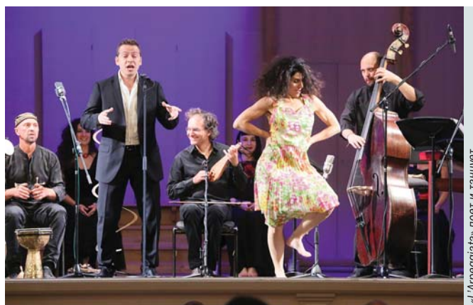
«L'Arpeggiata» - poet and dancer

World premieres for the Russian (Anton Batagov and Olga Viktorova) and Japanese (Toshio Hosokawa) composers; European and Asian soloists, ensembles, orchestras, choirs; contemporary and classical music. The world-music project «From the Levant to the Maghrib» combined folk music of Mediterranean countries and Sufi hymns. A special youth project was introduced by the Ural Youth Symphony Orchestra and the Hong Kong Youth Symphony Orchestra.