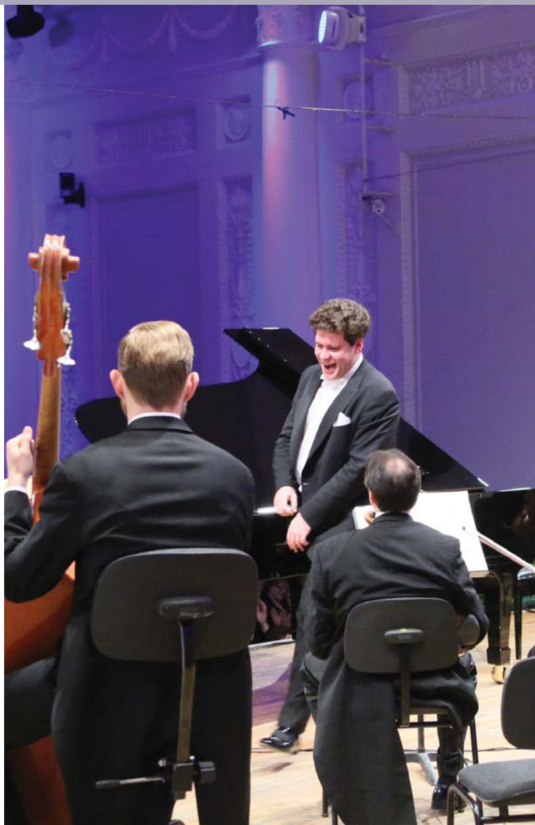
Денис Мацуев и «Вена – Берлин». Лучшие из лучших