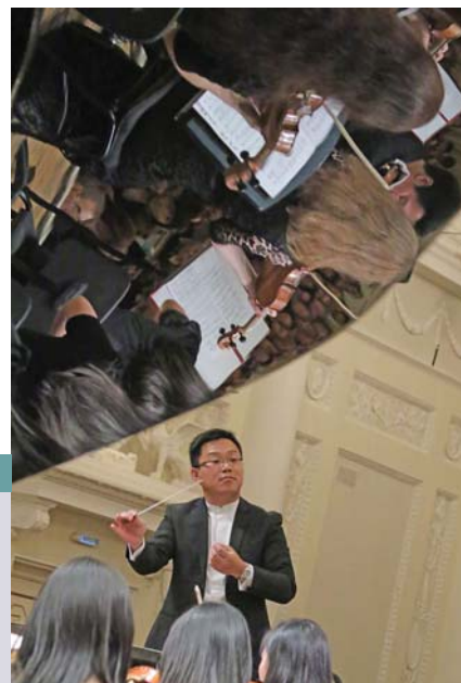
Гонконгский оркестр в Екатеринбургe и Алапаевске

The network of branch halls of the Concert Hall in seven cities of Sverdlovsk region.