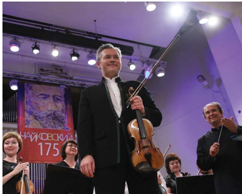
Вадим Репин и УАФО. Посвящается Чайковскому

В 2015 году Фестиваль П.И. Чайковского стал официальной культурной программой Международной промышленной выставки «Иннопром» в Екатеринбурге.