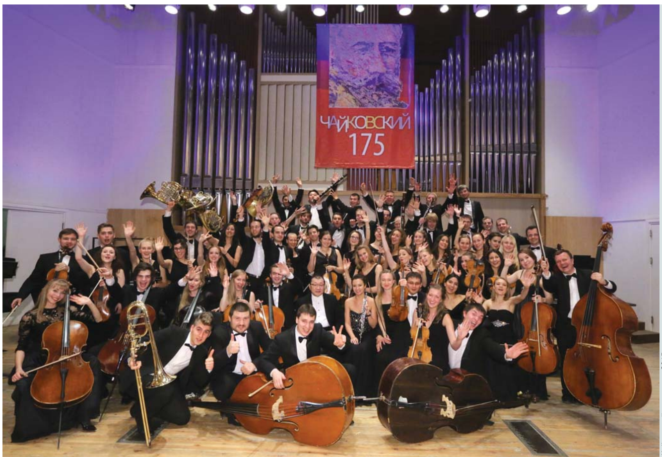
Чайковский-оркестр – 2015

After their internship at the Summer Orchestral Academy, all the musicians received certificates, which were handed to them at the official ceremony with participation of Pavel Krekov, Minister of Culture of the Sverdlovsk Region, and representatives of the consulates of Spain, Azerbaijan, and Kazakhstan.