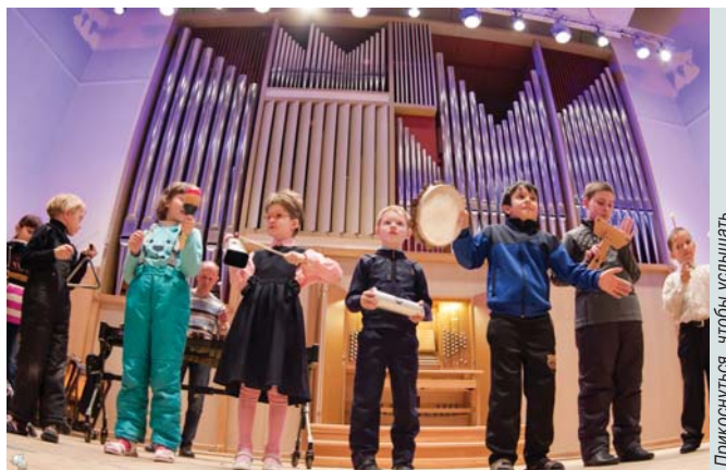
Прикоснуться, чтобы услышать

An important element of the inclusion was a series of tours to the Sverdlovsk Philharmony, during which hearing-impaired children were able to watch a music-making process, to touch music instruments, feeling their vibrations to support personal hearing and visual sensations.