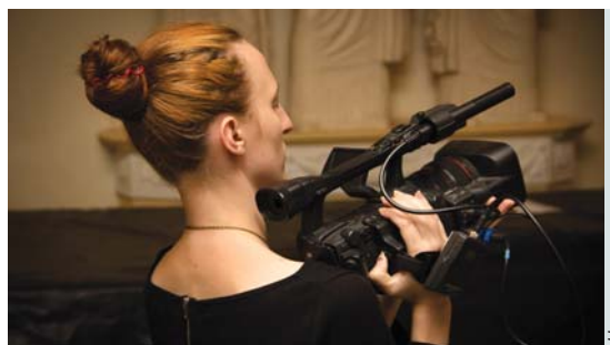
Ничто не останется незамеченным