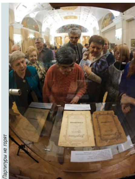
Партитуры не горят