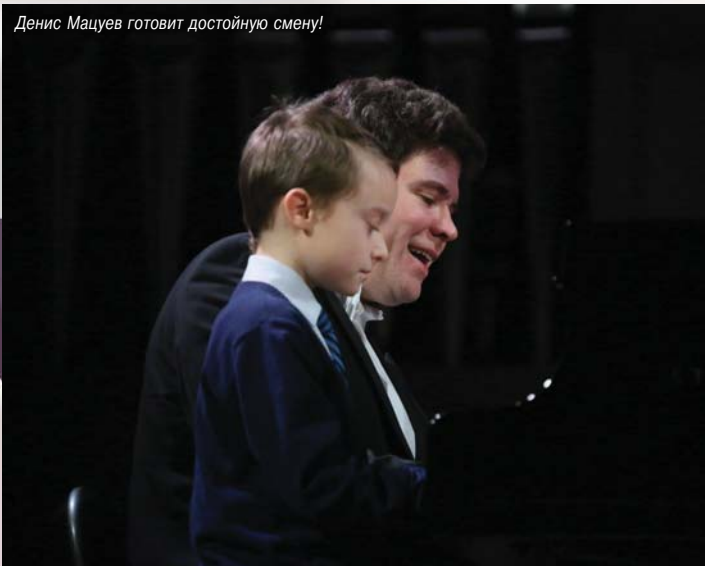
Денис Мацуев готовит достойную смену!