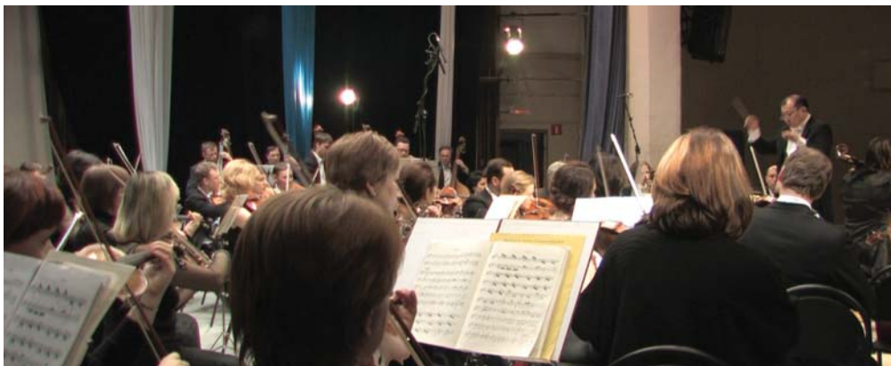
УАФО в Серове – 20 лет спустя!

The project started its life on March 9 with a concert given by the Ural Philharmonic Orchestra in Serov. The concert audience included guests of Philharmonic Assemblies of Serov, Krasnoturinsk, Gari, Karpinsk, Severouralsk, Novaya Lyalya, Kachkanar, Verkhoturie, and Sosva. The 4 th Forum of Philharmonic Assemblies took place on July 12.