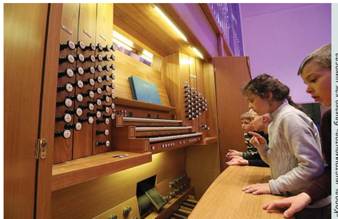
«Король инструментов» близко как никогда