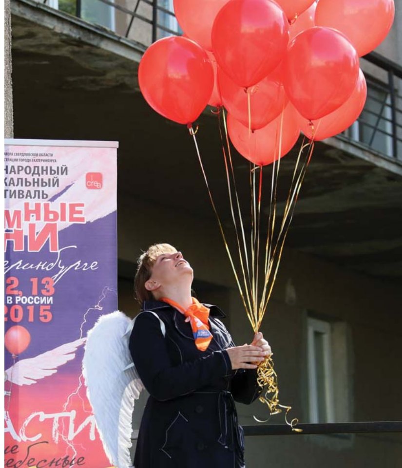
Улетели, но обещали вернуться