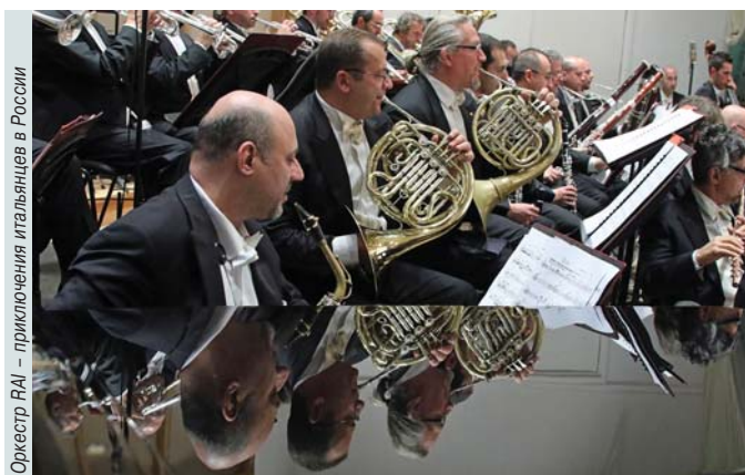
Orchestra RAU – participation of Italians in Russia

Мировые премьеры от российских (Антон Батагов и Ольга Викторова) и японского (Тосио Хосокава) композиторов; европейские и азиат- ские солисты, ансамбли, оркестры, хоры; современная и класси- ческая музыка. World-music проект «От Леванта до Магриба» объединил народные напевы стран средиземноморского побережья и суфийские религиозные гимны. Специальный молодежный проект представили два коллектива: Уральский и Гонконгский молодежные симфонические оркестры.