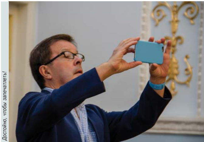
Достойно, чтобы запечатлеть!