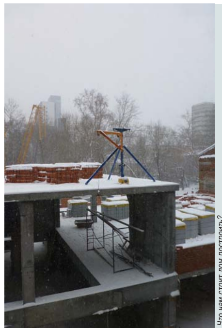
Что нам стоит дом построить?