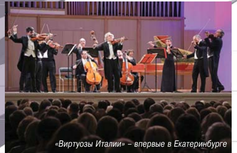
«Виртуозы Италии» – впервые в Екатеринбурге