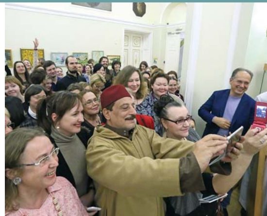
Селфи с шейхом

Combining traditional concert activities and advanced technology, the Sverdlovsk Philharmony embarked on creating a new type of regional concert space. Philharmony 2.0 is an innovative three-stage system giving an opportunity to residents of remote towns and villages to visit «virtual» concerts at 36 Philharmonic Assemblies held in the Sverdlovsk Region, go to concerts hosted by the closest branch of the Sverdlovsk Philharmony and get together in the Grand Hall of the Sverdlovsk