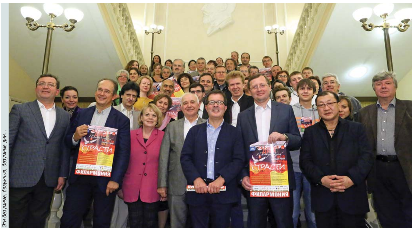
Эти безумные, безумные, безумные дни...

The festival took place with support from the governor of the Sverdlovsk Region and with the assistance of the Ekaterinburg City Administration.